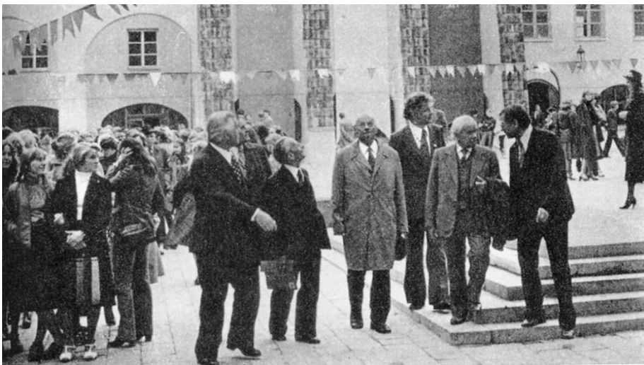
Vilniaus universitetui – 400 metų minėjimas. Sarbievijaus kieme lankosi daug svečių. Tarp jų ir TSRS Mokslų akademijos prezidentas A. Aleksandrovas, 1979 m.