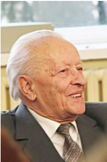
Akademikas Jonas Kubilius, 2010 m.