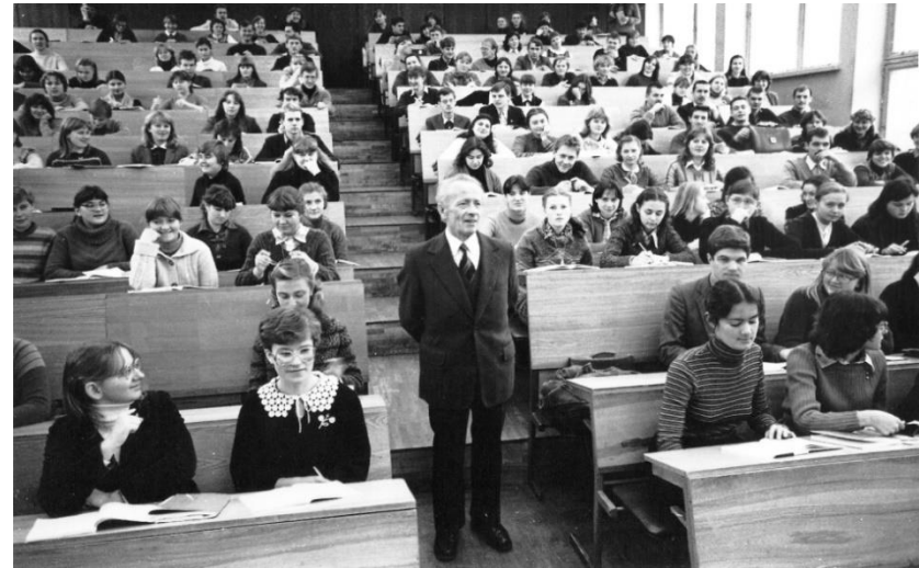
Prof. Jonas Kubilius paskaitoje, 1957 m.