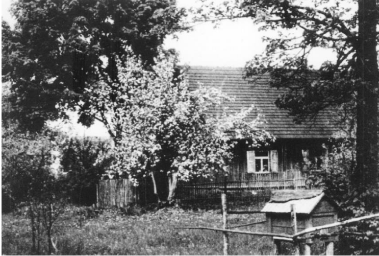
Šiame name 1921 m. liepos 27 d. gimė Jonas Kubilius