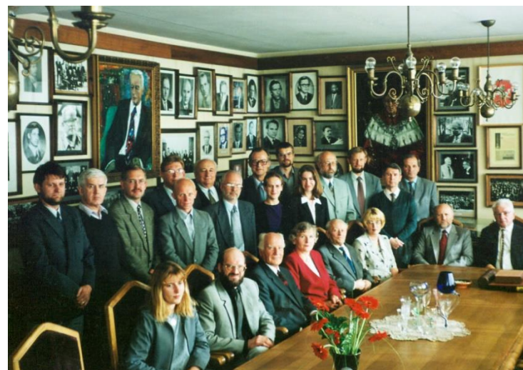
VU Tikimybių teorijos ir skaičių teorijos katedros darbuotojai Matematikų muziejuje, 2000 m.