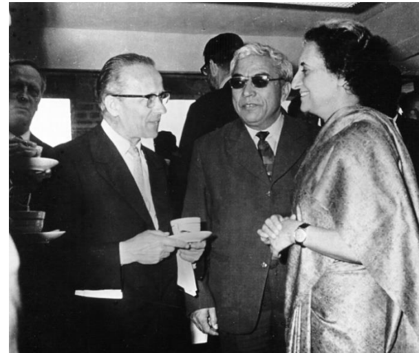
Su Indijos premjere Indira Gandhi Delyje, 1975 m.