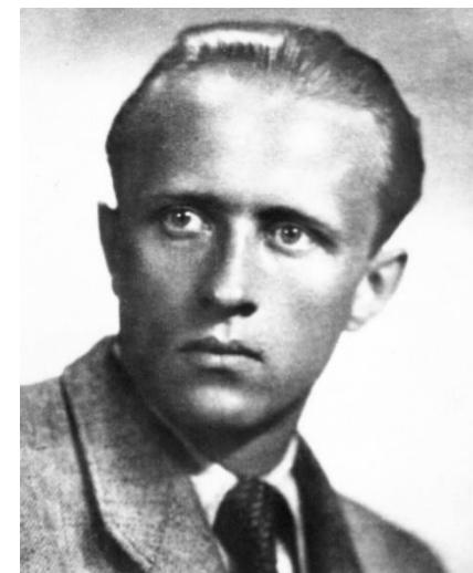
Jonas Kubilius – Parengiamųjų kursų prie Vilniaus universiteto direktorius, 1947 m.