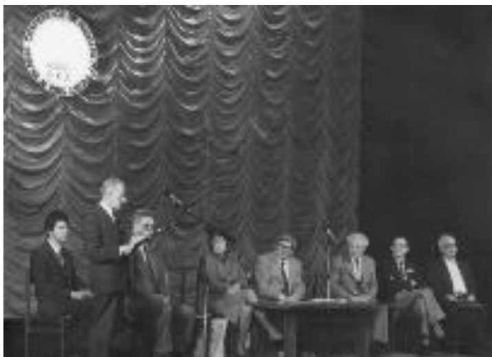
Prof. J. Kubilius kalba 4-osios Vilniaus konferencijos tikimybių teorijos ir matematinės statistikos klausimais atidarymo posėdyje, 1985 m.