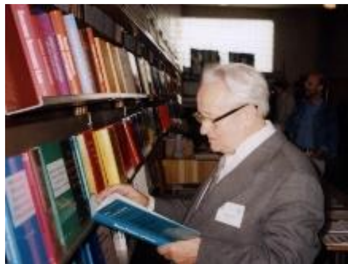
J. Kubilius naujų mokslinių knygų parodoje, 1998 m.