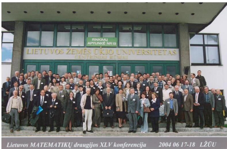
Lietuvos MATEMATIKŲ draugijos XLV konferencija 2004 06 17-18 LŽŪU

Lietuvos matematikų draugijos XLV konferencijos Kaune dalyviai. J. Kubilius – pirmoje eilėje penktas iš kairės, 2004 m.