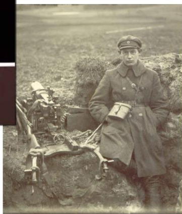
Lietuvos Nepriklausomybės akto signatarų klubas Vyčio paramos fondas

Valstybės atkūrimo 100-mečiui - solidžiausia istorinė monografija apie pirmąjį Respublikos Prezidentą